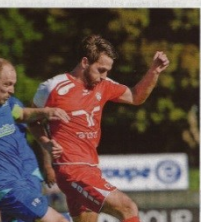
400 mètres sur une tête de... Grâce à une victoire sur le fil contre Farvagny (3-0), Bulle ira à Portablan pour jouer le titre et la promotion. Des nerfs, un héros et une «finale».

L'Équipe Inter se la fait offrir. En l'absence de... Grâce à une victoire sur le fil contre Farvagny (3-0), Bulle ira à Portablan pour jouer le titre et la promotion. Des nerfs, un héros et une «finale».